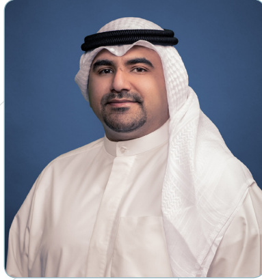
نائب رئيس اللجنة العليا عبدالله نبيل السنان