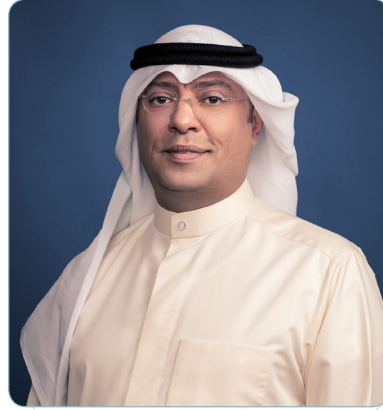
رئيس اللجنة العليا محمد سليمان العتيبي