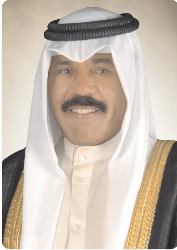
حضرة صاحب السمو الشيخ نواف الأحمد الجابر الصباح أمير دولة الكويت حفظه الله ورعاه