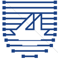
وحدة تنظيم التأمين Insurance Regulatory Unit

وتضم الهوية كلاً من (البوم الكويتي) الذي يعكس الهوية الكويتية للوحدة، كما يعتبر رمزاً لأقدم أنواع التأمينات على الإطلاق ألا وهو التأمين البحري، كما أتت الهوية باللون الأزرق (رمز كويتي) وهو لون البحر الذي يرمز إلى القوة والجد والكفاح.