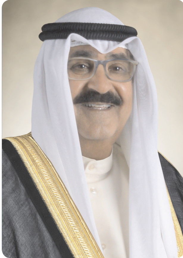
سمو الشيخ مشعل الأحمد الجابر الصباح ولي عهد دولة الكويت حفظه الله ورعاه